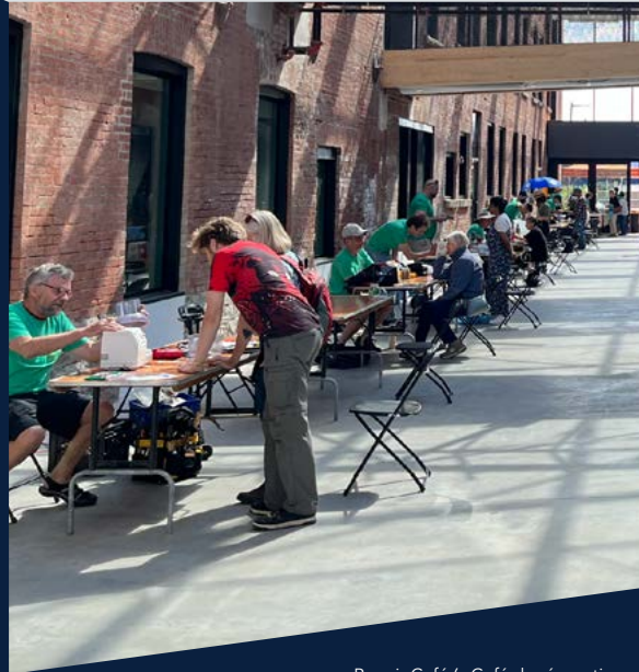
Repair Café (« Café de réparations ») animée par le Ottawa Tool Library