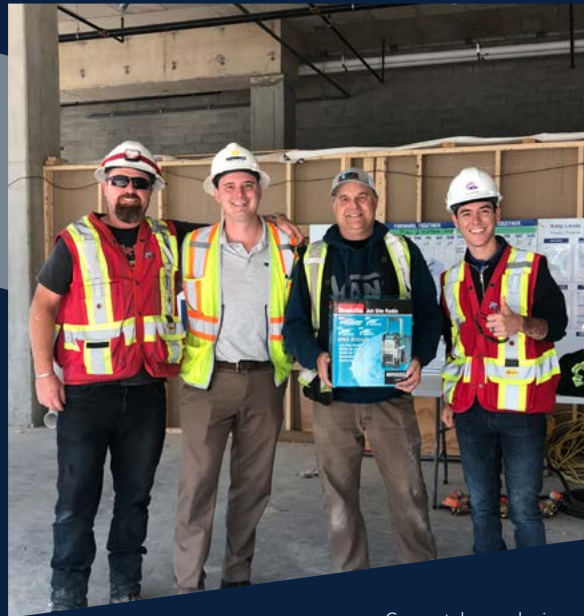
Gagnant du grand prix pour l'Entrepreneur du mois