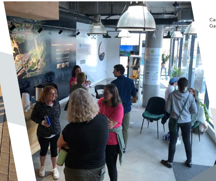
Candid shot at the Gardening Workshop