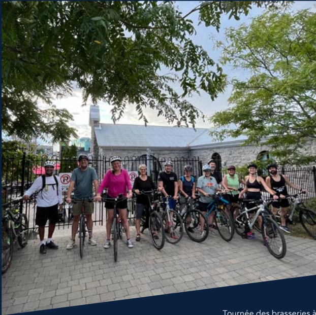
Tournée des brasseries à vélo en groupe