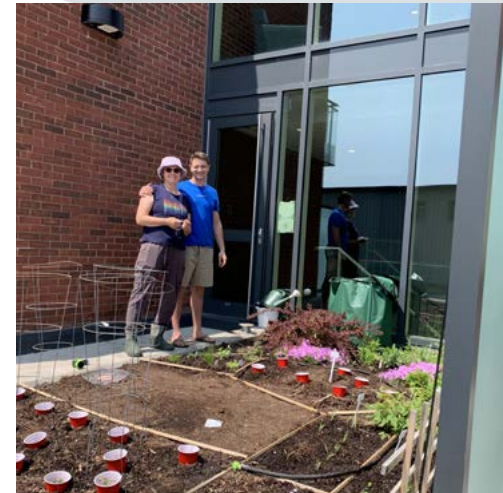
Des jardiniers aux condos de Kanaal