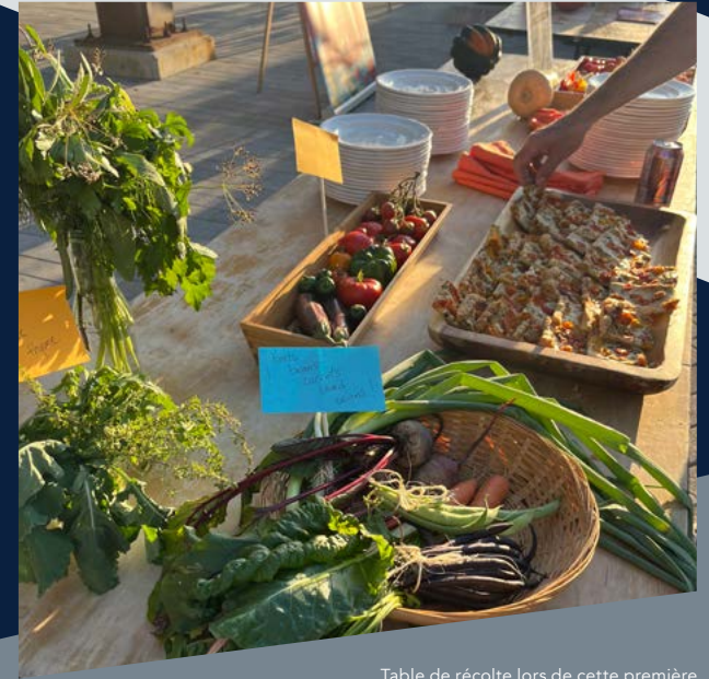
Table de récolte lors de cette première fête annuelle de la récolte