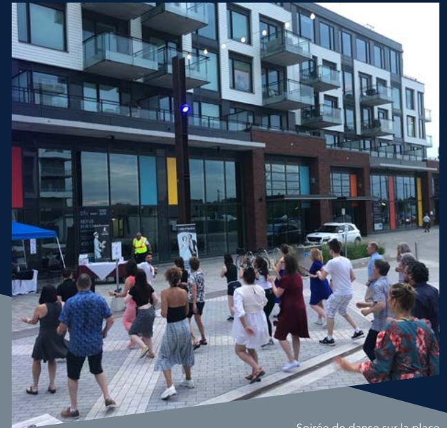
Soirée de danse sur la place Head Street animée par le Fred Astaire Dance Studio d'Ottawa