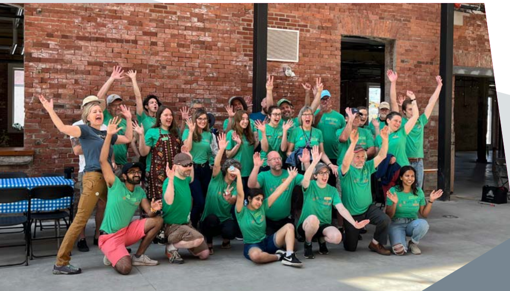
Réparateurs bénévoles du Repair Café pour le Ottawa Tool Library